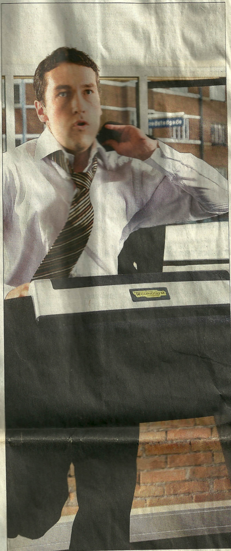
Mach mal Pause! Zu viel Stress führt in den Abgrund.